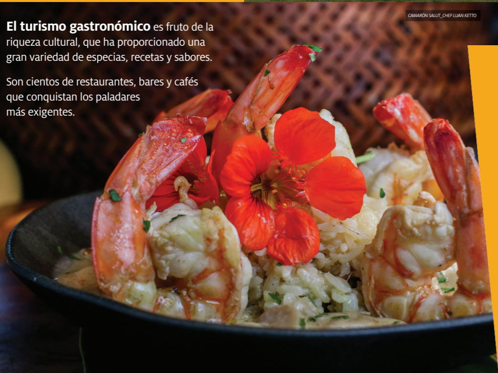
CAMARÃO SALTO, CHEF LUIAN NETTO

Son cientos de restaurantes, bares y cafés que conquistan los paladares más exigentes.