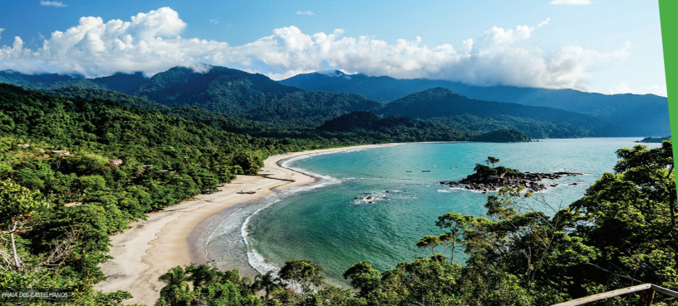
PIÇA DOS CASTELHANOS

Las agencias de viaje receptivas ofrecen paseos off-road a Castelhanos. Después de disfrutar de la aventura en jeep por la Mata Atlántica, los turistas llegan a la playa, que alberga dos comunidades tradicionales caiçaras.