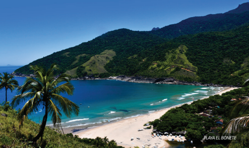
PLAYA EL BONETE

Hermosa, acogedora y segura, Ilhabela es uno de los 65 Destinos de Fomento del Turismo Brasileño, consolidándose en el escenario turístico nacional.